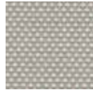
B3-0720 Pearl Linen