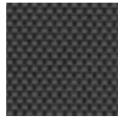
B3-3001 Charcoal Grey