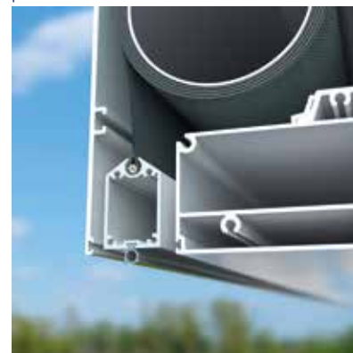
El perfil de contrapeso desaparece en el marco

Los perfiles del marco de la línea Camargue se desarrollan de tal manera que el perfil de contrapeso se oculta estéticamente cuando se sube el estor. ¡Perfecta integración, incluso a posteriori!