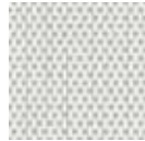
B3-0207 White Pearl