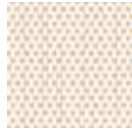
B3-0220 White Linen