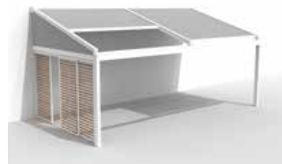
Lagune con paneles deslizantes Loggiawood en el lateral