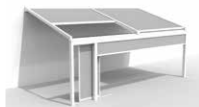
Lagune equipada con Fixscreen y paso rápido Loggiascreen Canvas en el frontal