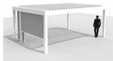
Camargue equipada con Fixscreen y paso rápido Loggiascreen Canvas en el lado Span