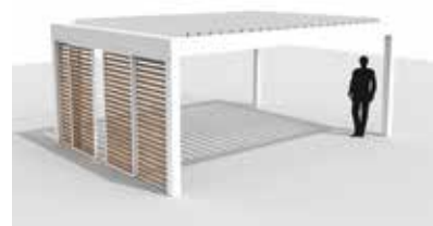
Camargue line equipada con paneles Loggiawood en el lado Span